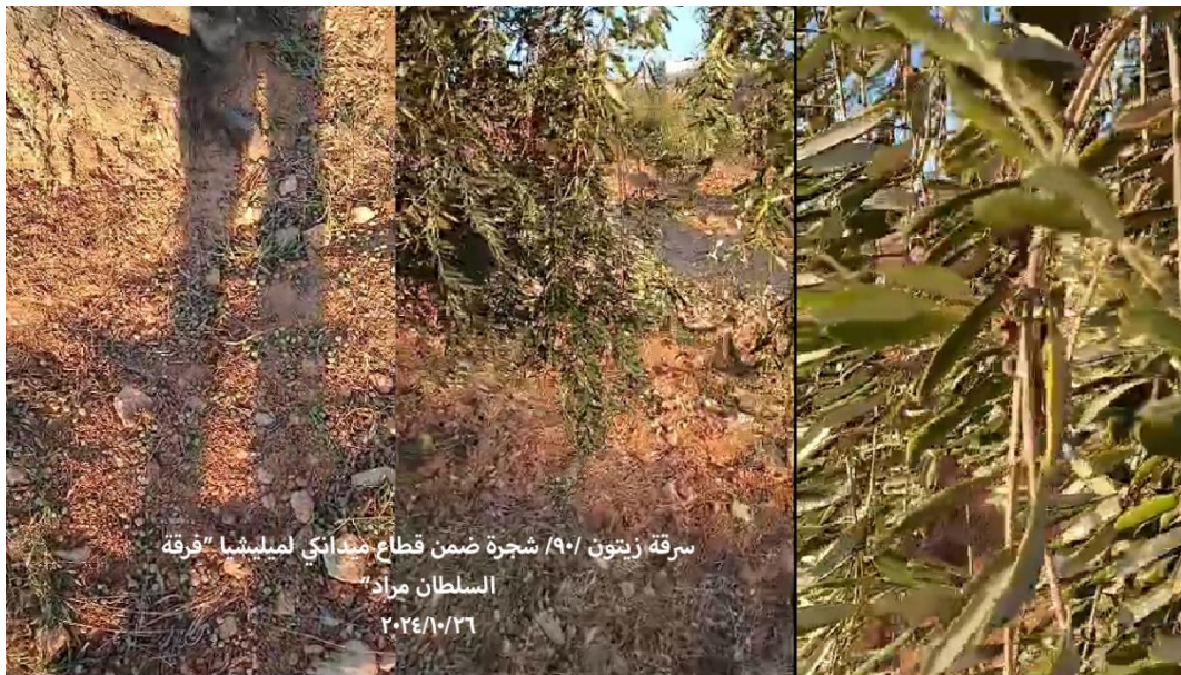
سرقه زيتون /٩٠/ شجرة ضمن قطاع مبدائي لميليشيا "فرقة السلطان مراد ٢٠٢٤/١٠/٢٦