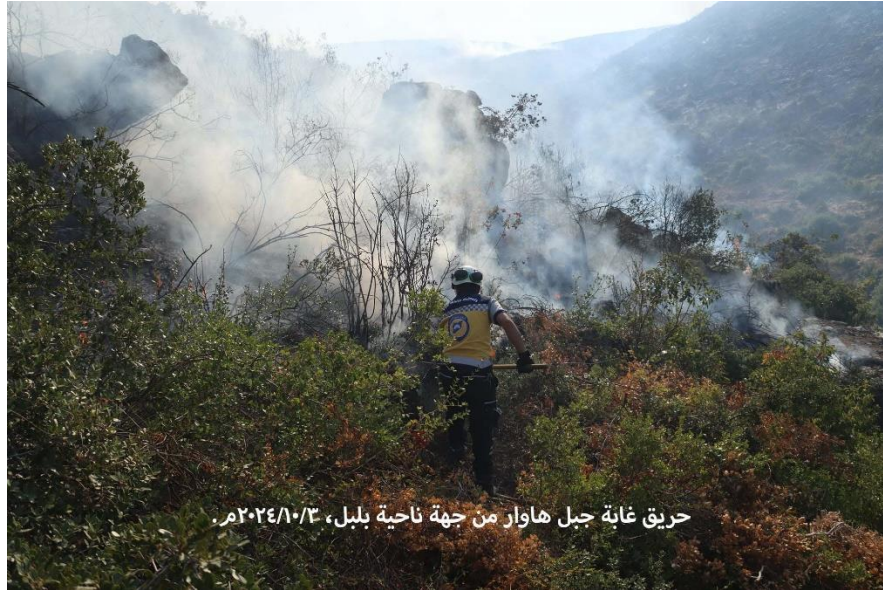
حريق غابة جبل هاوار من جهة ناحية بلبل، ٢٠٢٤/١٠/٣ م.

- Li 03.10.2024an. Z, jî nû ve dûman li ser Çiyayê Hawarê -ji aliyê Navça Bilbilê ve- bilind bû, yê ku berê bêtirî 80% ji daristana wê ya xwezayî hatiye şewitandin, û "Berevaniya Sivîl a Sûrî" tekez kir ku tîpên wê bi riyên cudakirina wê ji derdorê, alîkarî di vemirandina şewatê de kiriye.