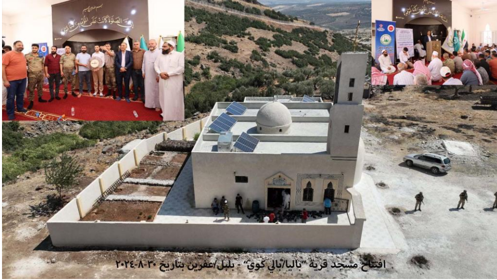
افتتاح مسجد قرية "بالمبا/بالي كوي" - بلبل/عفرين بتاريخ ٢٠٢٤-٨-٣٠

17 Eylül 2024 tarihinde "Beyaz Eller Derneği", Şerava bölgesindeki "Şadıre" köyünün güneyinde bulunan "Basme" yerleşim köyünde yeni konut birimlerinin inşasına devam edildiğini duyurdu.