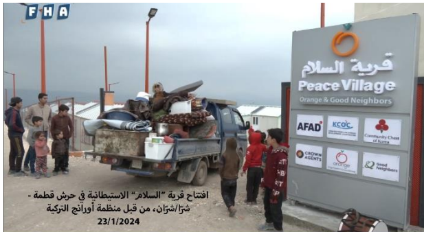
افتتاح قرية "السلام" الاستيطانية في حرش قطة - شبرا/شتران، من قبل منظمة أورانج التركية 23/1/2024