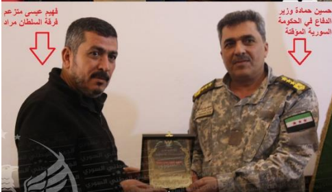
قائد فرقة السلطان مراد فهميد جيسي متزعّم