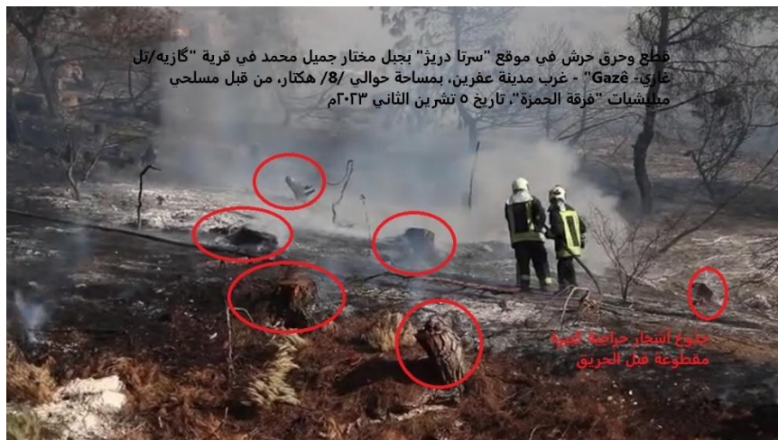
قطع وحرق حرش في موقع "سرتا دريز" بجبل مختار جميل محمد في قرية "غازيه/تل غازي- Gazeh" - غرب مدينة عفرين، بمساحة حوالي 8/ هكتار، من قبل مسلحي ميليشيات "فرقة الحمزة" تاريخ ٥ تشرين الثاني ٢٠٢٣م