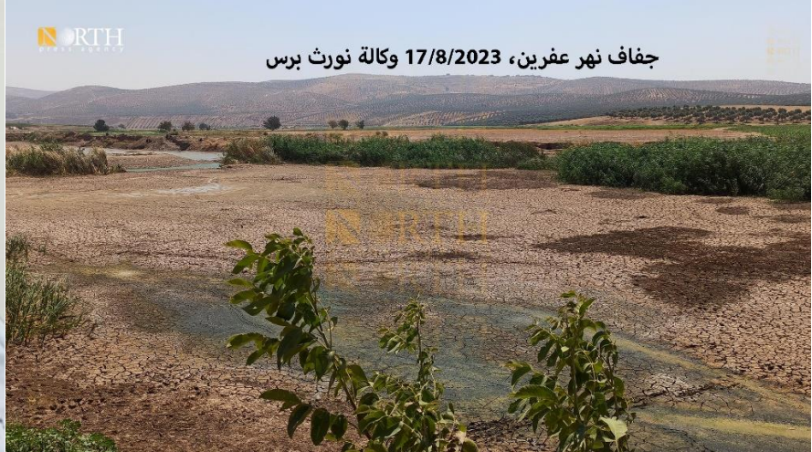
جفاف نهر عفرين، وكالة نورث برس، 17/8/2023