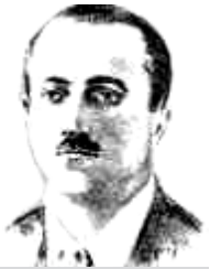
Osman Sebrî 1905 - 1993