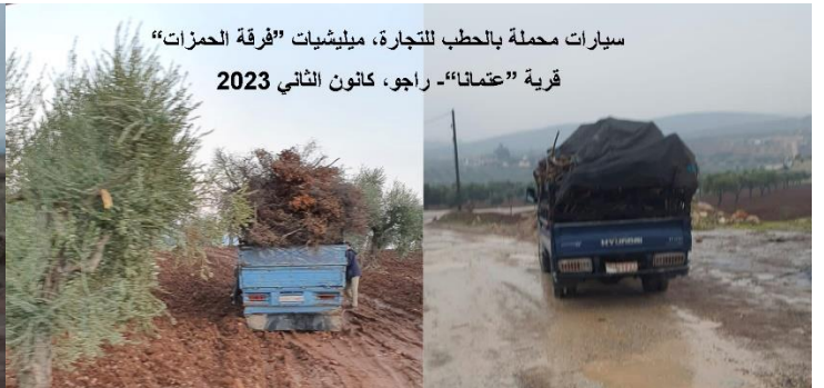
سيارات محملة بالحطب للتجارة، ميليشيات "فرقة الحمزات" قرية "عثمانا" - راجو، كانون الثاني 2023

Di van herdu heftên borî de "Desteya Tehrîr El'sam" ya terorîst bi rengekî aqîq dest bi diyarkirina xwe kiriye, û ketiye şeş biryargehên Milîseyên "Firqit El'sultan Mûrad" -bê ku simbolên xwe li ser hilde- li orta Bajarê Efinê yê kevin; Ew herşêş biryargeh ev in: (Avahiyên Xercgeha Destgirtina Diravî ya Gelêrî "Mesref El'teslîf El'se'ibî", Diravî/Malî", Dibistana Kevin û sê malan), yên ku li Bakurê Avahiya "Sera Kevin" bi rengekî yekser dikevin - biryargeha Waliyê Turkiyê, û hebûna endamên xwe têde li rex endamên "Mûrad" ên ku tevê bûne pir kir.