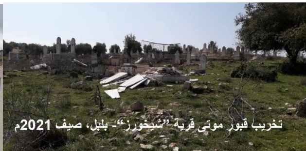
تخریب قبور موتی قریة "شخورز" - بلبل، صیف 2021م