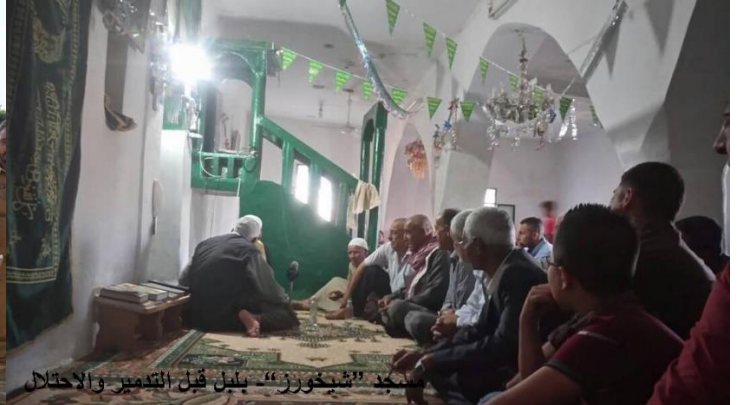
مسجد "شخورز" - بلبل قبل التدمير والاحتلال