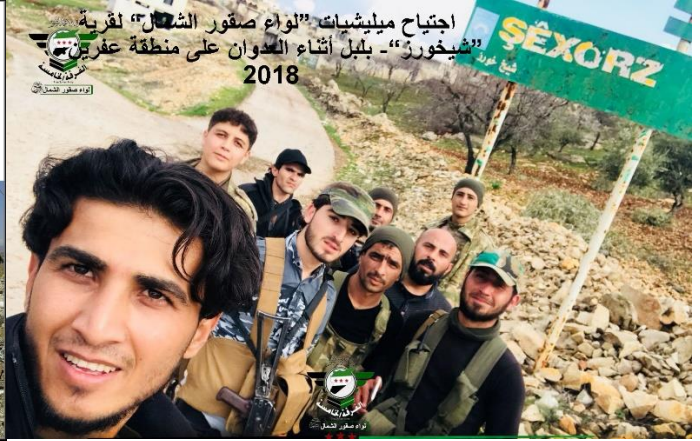
اجتياح ميليشيات "لواء صقور الشمال" لقرية "شخورز" - بلبل أثناء العدوان على منطقة عفرين، 2018