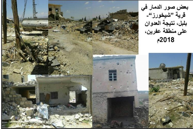
بعض صور الدمار في قرية "شخورز" - بلبل، نتيجة العدوان على منطقة عفرين، 2018م

Gundê "Şêxorzê" - roxandina mizgeftê û koçberkirineke fere, girtinine bêsûcane, qutkirineke fere ji darên zeytûnê re, "Ebû Emşe" vêrgiyine nû li ser "Mabeta" ferz dike, geregoşî û hebûneke ji "Desteya Tehrîr El'şam" re