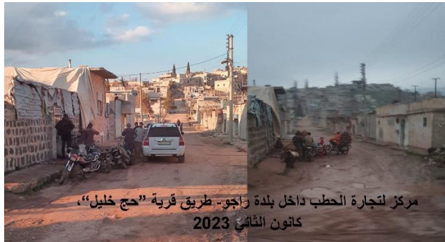
مركز لتجارة الحطب داخل بلدة راجو- طريق قرية "حج خليل"، كانون الثاني 2023