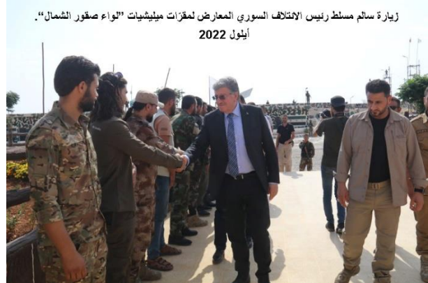
زيارة سالم مسلترئيس الائتلاف السوري المعارض لمقرات ميليشيات "لواء صقور الشمال". أيلول 2022