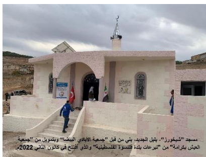
مسجد "شخورز" - بلبل الجديد، بني من قبل "جمعية الأحياء البيضاء" ويتكون من "جمعية الجيش بكرة" من "ممرعات بلدة قلنسوة للسلطنة" والذي أفتتح في كانون الثاني 2022.