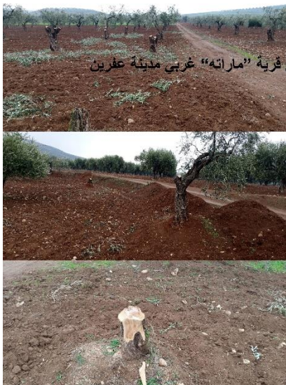
قطع أشجار الزيتون في قرية "ماراته" غربي مدينة عفرين