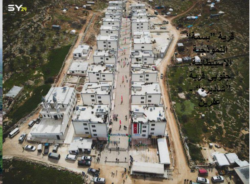
قرية "بسمه" النموذجية الاستيطانية جنوبي قرية "شاديره" عفرين