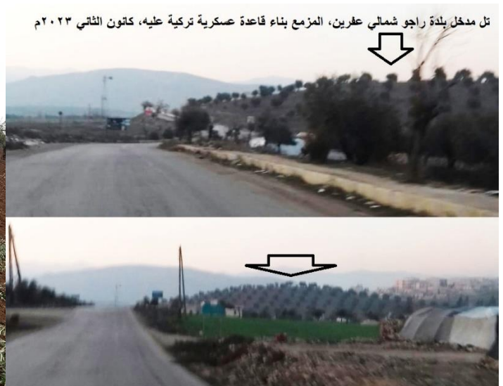
تل مدخل بلدة راجو شمالي عفرين، المزمع بناء قاعدة عسكرية تركية عليه، كانون الثاني ٢٠٢٣ م