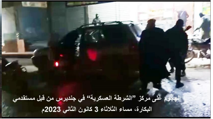
الهجوم على مركز "الشرطة العسكرية" في جنديرس من قبل مستقلمي البقارة، مساء الثلاثاء 3 كانون الثاني 2023م