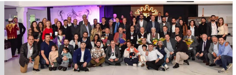
حفل تكريم درج موقع تبريج عشرين السنوي العاشر (صالحة حياة ايفنت - كوكون - المانيا) جانب من السادة الحضور والمشاركين في فعاليات حفل تكريم درج تبريج عشرين العاشر

Pir giring e her kesê koçbarî welêt bûye di mal de, di dewatan de, ne tenê bi kurdî biaxife, guhdarî stranên kurdî bike, di mal û gera xwe de, beşdarî pêşengehên hunerî bibe, ji zarokên xwe re wan huneran şirove bike, da ku ew zarok rêzdariya wan nas bikin, rêzdariya gelê xwe bigrin ku ew jî mîna