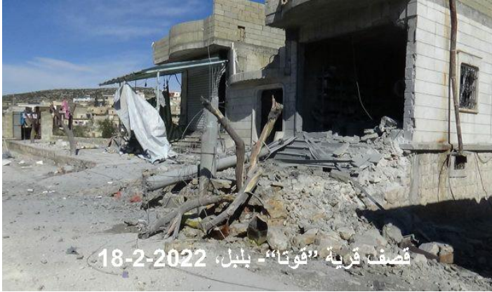
قصف قرية "قوتا" - بلبل، 18-2-2022