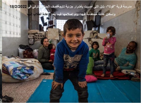
مدرسة قرية "قوتا" - بلبل التي أصيبت باضرار جسيمة نتيجة قصف الجيش التركي في 18/2/2022 وإسكان عائلة مستعدة فيها، وتم إصلاحها فيما بعد، عادة الطلاب فيها