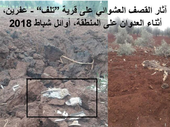
آثار القصف العشوائي على قرية "تلف" - عفرين، أثناء العدوان على المنطقة، أوائل شباط 2018

Gundê "Tilifê" - koçberkirineke fere, teqandina matoreke dutekerî, şewtandina daristanana, vêrgiyeke werziyane (mewsimî), dizîna berhemên zeytûna berî bûyînê