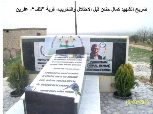
ضريح الشهيد كمال حنان قبل الاحتلال والتخريب - قرية "تلف" - عفرين