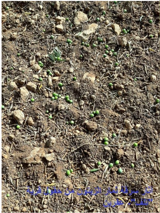
شراء زيت الزيتون من عفرين قبل الاحتلال