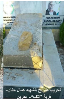
تخريب ضريح الشهيد كمال حنان - قرية "تلف" - عفرين