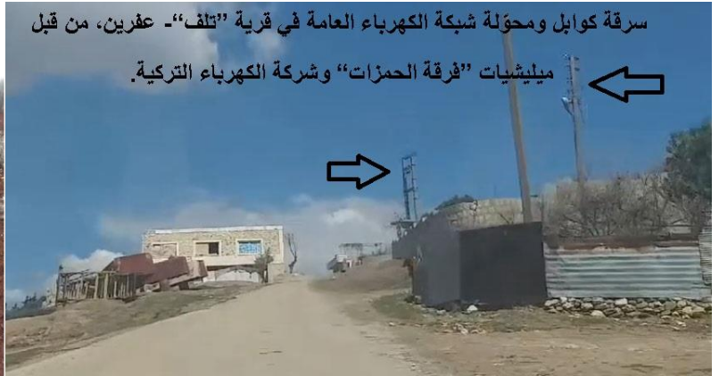
سرقة كوابل ومحوّلة شبكة الكهرباء العامة في قرية "تلف" - عفرين، من قبل ميليشيات "فرقة الحمزات" وشركة الكهرباء التركية.