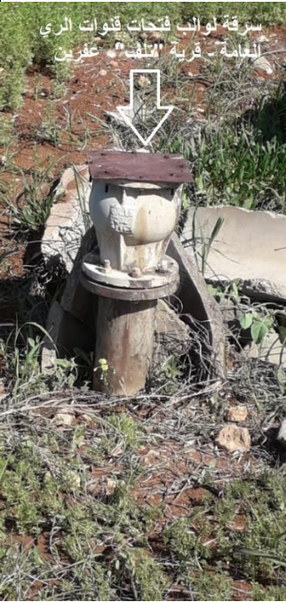
سرقة لوانب فتحات قنوات الري العامة - قرية "تلف" - عفرين