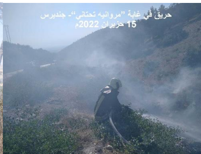
حريق في غابة "امروانده تحمالي"- جنديرس 15 حزيران 2022م