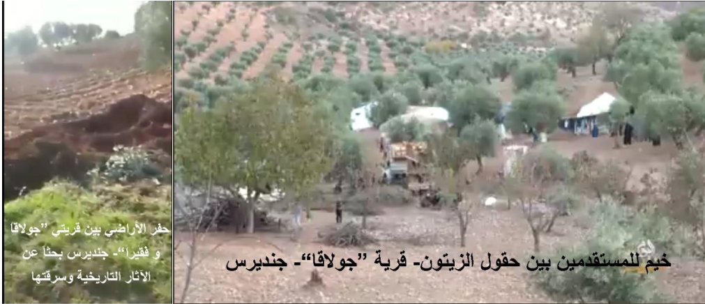
حفر الأراضي بين قرينتي "جولاقا" و فقيرا"- جنديرس بحثاً عن الآثار التاريخية وسرقتها

Gundê"Çolaqa" - desteserkirin û niştecîkirin, pevçûnin li ser erdekî desteserkirî, dijberiyek li ser temenmezinekî Êzdî, şewatên daristanan û dizîna kevneşopan