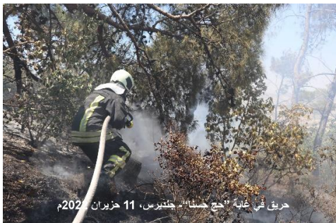
حريق في غابة "حج حسنا"- جنديرس، 11 حزيران 2022م