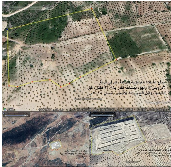
موقع القاعدة العسكرية التركية، شرقي قرية "أرويش" - راجو، بمساحة تقدر بـ ١٦,٥ هكتار، قبل احتلالها، وقبل قمع وإزالة الأشجار، شباط ٢٠١٨ م.