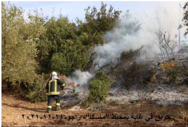
حريق في غابة بمحيط "ماسكا" - راجو، ١٤-١١-٢٠٢١