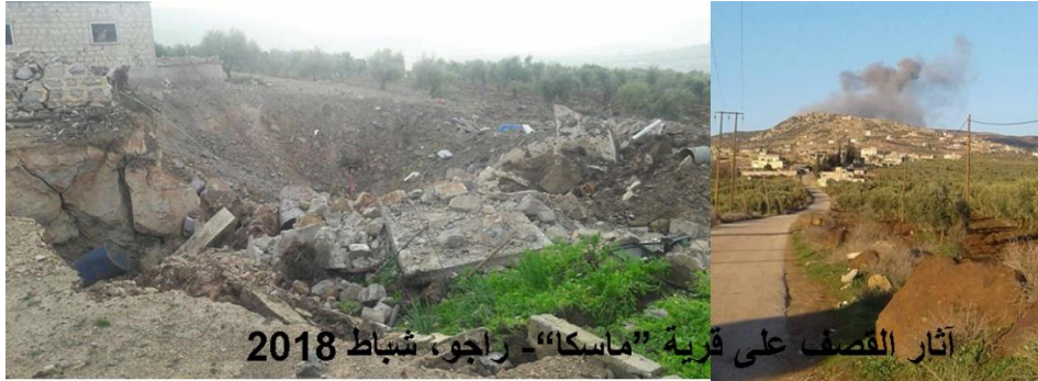
آثار القصف على قرية "ماسكا" - راجو، شباط 2018

Gundê "Maseka" - guhertineke demografî, girtinine bêsûcane, pevçûnên milîseyan û birîndarbûna temenmezinekî, qutkirina dar û daristanina