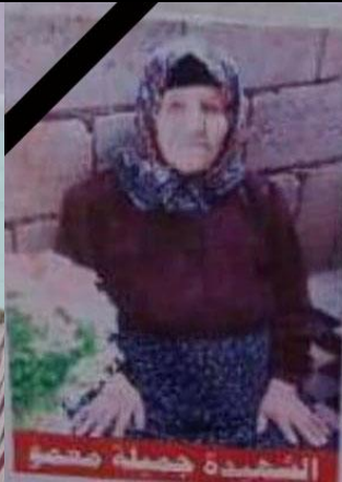
الشيخة حصة منصور