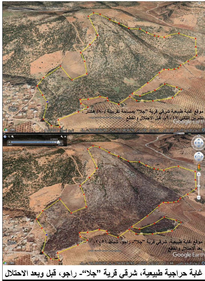
غابة حراجية طبيعية، شرقي قرية "جلا"- راجو، قبل وبعد الاحتلال