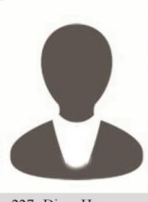
227- Diyar Hemo Hisên