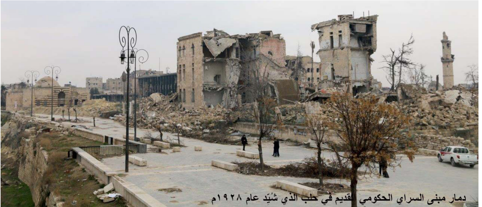
دمار مبنی السرای الحكومي القديم في حلب الذي شيد عام ١٩٢٨ م