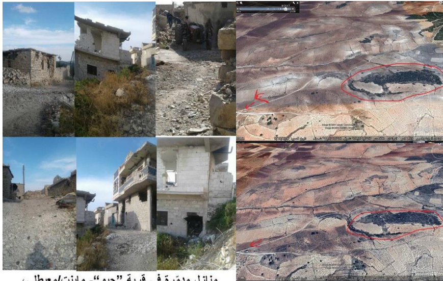
منازل مدمرة في قرية "حبو" - مابنت/معيطلي، شباط - آذار ٢٠١٨م