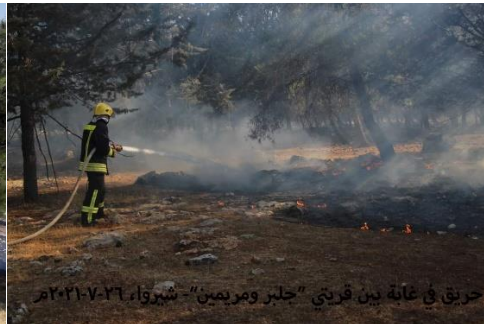
حريق في غابة بين قرى "جلبر ومريمين" - شروا، ٢١-٧-٢٠٢١م