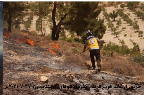
حريق في غابة قرب قرية "كفرالوقواق" - خندوس، ٢٧-٧-٢٠٢١م