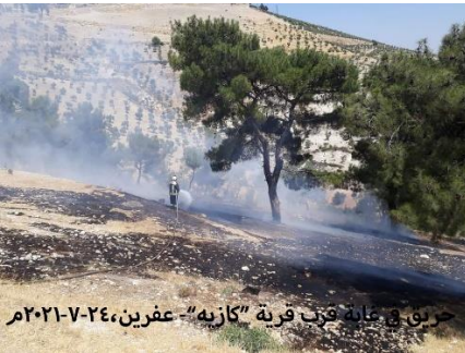
حريق في غابة قرب قرية "كازيه" - عفرين، ٢٤-٧-٢٠٢١م