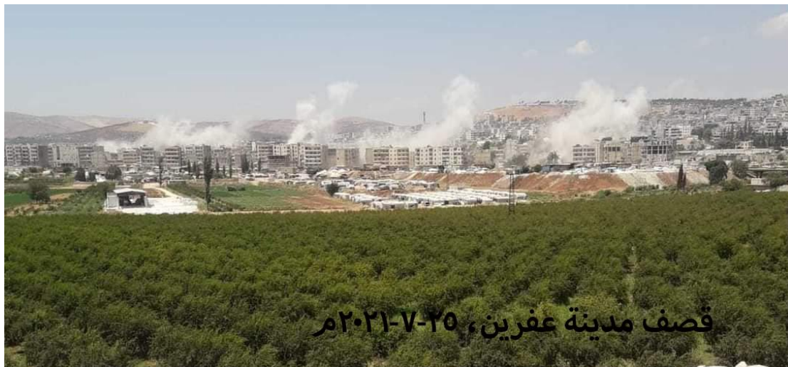
قصف مدينة عفرين، ٢٥-٧-٢٠٢١م