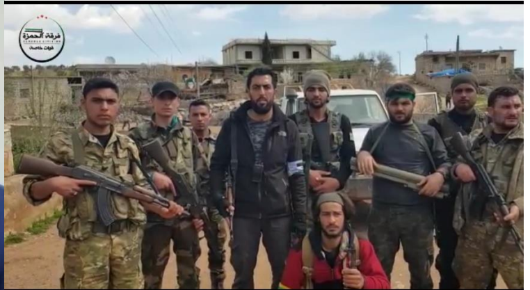
فرقة الحمراء قوات خاصة