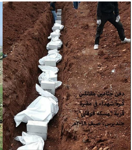
دفن جنائز مقاتلين كورد شهداء في مقبرة قرية "مسكه فوقاني" - جندريس، صيف ٢٠١٨م