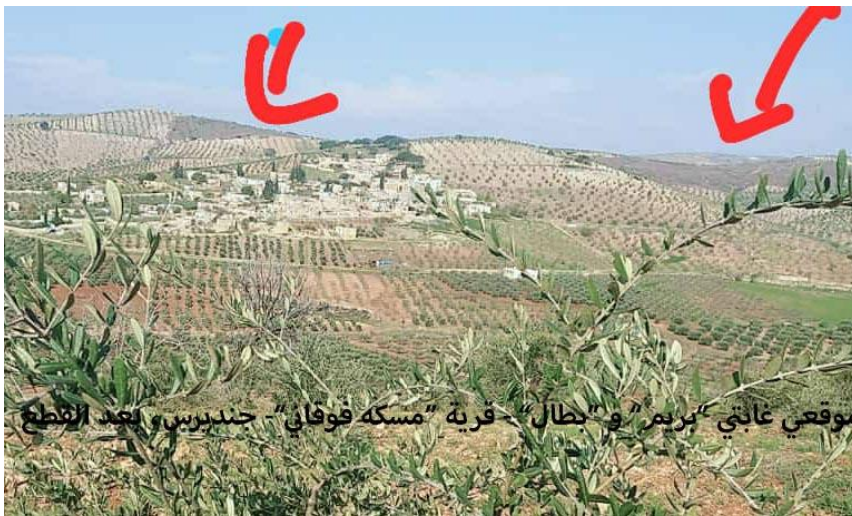
موقعي غابتي "بريم" و "بطال" - قرية "مسكه فوقاني" - جندريس، بعد القطع