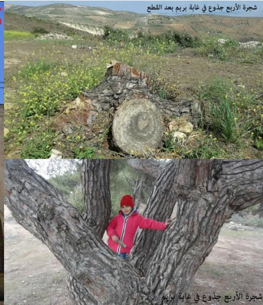
شجرة الأربع جذوع في غابة بريم بعد القطع