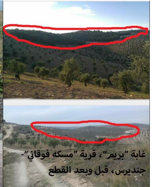
غابة "بريم"، قرية "مسكه فوقاني" - جندريس، قبل وبعد القطع