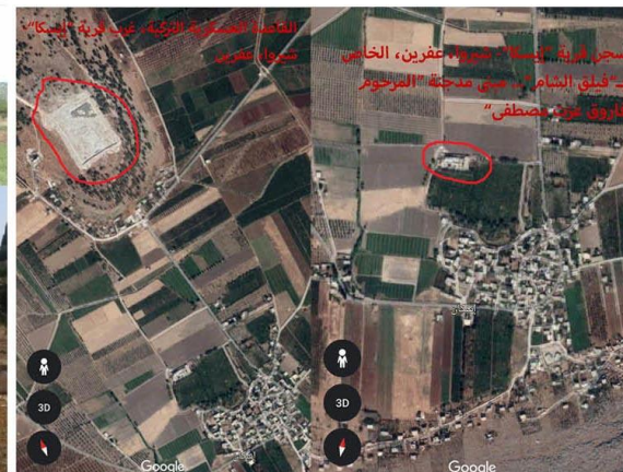
المسجد العمومي التركي في قرية "إسكا"، مسجد القرية "إسكا" - شرق عفرين، الخاضع بي قبلي الشام - مبنى مدرسة "الفرحون" - شارع "عز الدين مصطفى" -