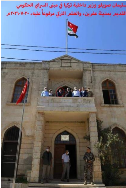
سليمان صويلو وزير داخلية تركيا في مبنى السراي الحكومي القديم بمدينة عفرين، والعلم التركي مرفوعاً عليه، ٢٠٠٧-٢٠٢١م