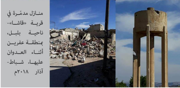
منازل مدمرة في قرية «قاشا» - ناحية ببل، بمنطقة عفرين أثناء العدوان عليها، شباط - آذار ٢٠١٨م