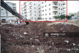
دفن جثامين ٢٢/٢٢ شهيداً في مقبرة وسط مدينة عفرين، ١٣ آذار ٢٠١٨م