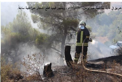
حريق في غابة بقرية جديريين، ٢٠١٧/٢٠١٦م، ويتبين فيها قطع اشجار حراخية سابقاً.