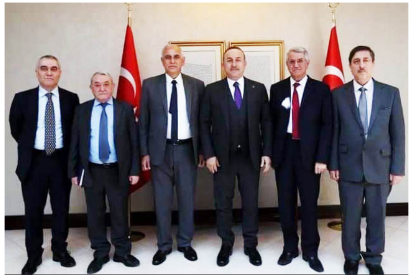
«Hevdîtina nûnerên ENKS bi Çawîş Oxlo re li Istenbûlê»

Û ji ber ku, ew milîseyên Islamî yên tundrew (ên ku, Kiwalisyon nûnertiya wan dike), di bin serpereştiya istîxbaratên Dewleta Turkiyê û sîwana Kiwalisyonê de, hemî binpêkirin, kiryarên qirêj û tewanan (kuştin, îdamkirin, girtin, lêdan, îşkencekirin, koçberkirin, zîndankirin, standina bace û vêrgiyan, revandina hemwelatiyan, destdirêjiya namûsê, qutkirin û hilkirin û şewtandina dar û beran, dizînen rengereg, guhertina demografi di gel dewleta Turk a dagîrker,