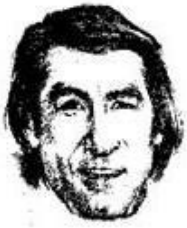
Dr. Nûredîn Zaza 1919 - 1988