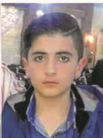
98- Ebid Ebdo