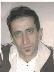
99- Cangîn Ebdo