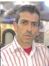
97- Henan Ebdo