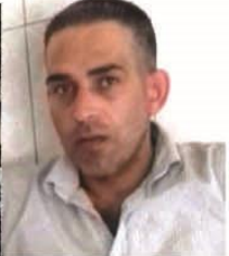
55- Xoşnav Henan

Lîsta /2/-18 Avadarê 2020an Amedekirin: Nivîsgeha ragihandinê- Efrîn/Partiya Yekîti ya Demokrat a Kurd li Sûriyê