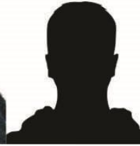
8- Henan Nexisan