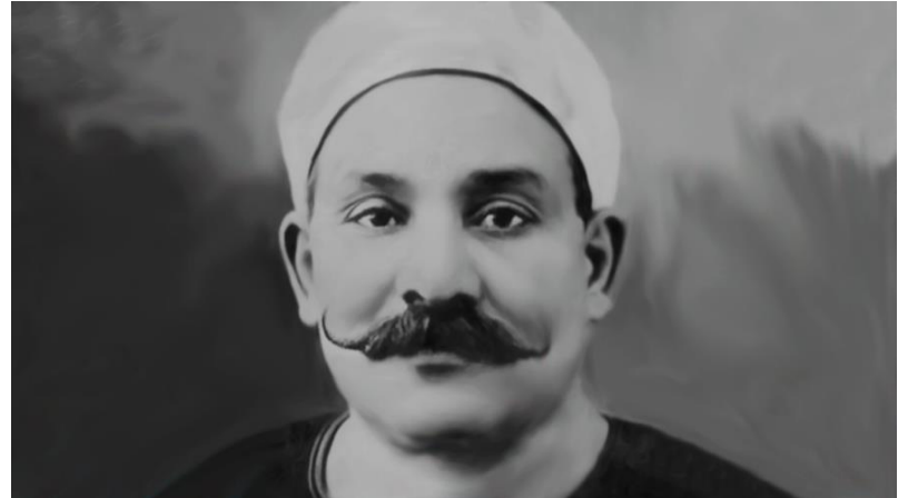
«Mostefa Lutfi Elmenfelotî nivîskar û wêjekarê Misriye (1876- 1924) an, xwediyê gotara (Mûyê Sipî-الشعرة البيضاء)»

Ey tayê sipî! Ez dibînim ko tu xwedî dek û rip î, tu, hêdîka, di guhê cîranê xwe de dikî»kur û pis» û tu, wan dixapînî, ko ew jî mîna te bibin, û cilên ko te li xwe kiriye ew jî li xwe bikin... Tu dixwazî di nav vî diyarê bê deng û bê gir-gêc de, ceng û ciladekê çêbikî...da ko her kes di bin lingan de biperçiqe...Tu, mîna insanê sipî dikevî nav welatê reşikan û wan dixapînî û tu wan rebenan ji xwe re dikî kole û bende.