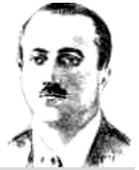
Osman Sebrî 1905 - 1993