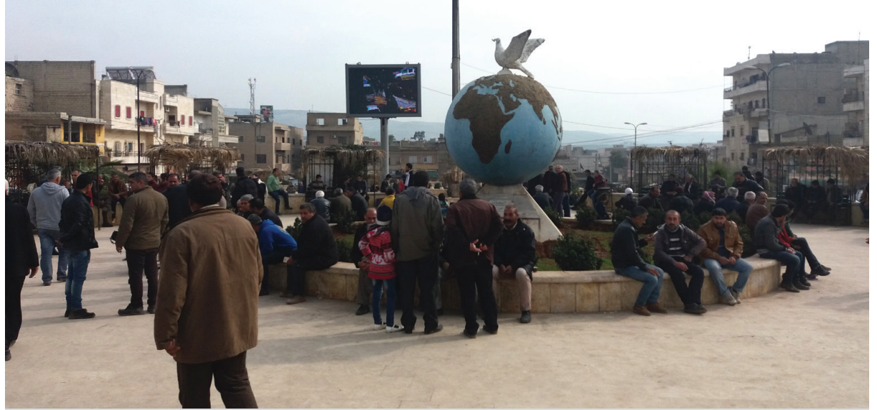
« Meydana Azadî-Efrîn, berî dagirkeriyê »

Ji derveyî hemû zagonên navnetewî û pîrensîpên mafên mirov û gelan, rojane