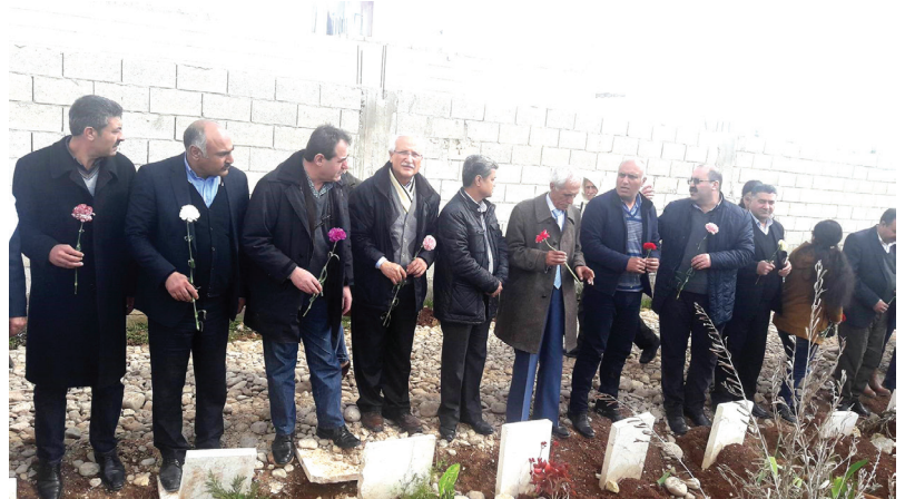
« Li ser gora Şehîdan-Efrîn, berî dagirkeriyê »

li vê dawiyê piştî gelek hewidanan ji aliyê Turkiyê ve bi dewletên xwedî hikar û piştî ku dest danî ser Ezaz, Cerablûs û Babê, xwest Efrînê jî dagîr bike da ku Rojavayê Çemê Ferêt tev de bixe bin destê xwe, da ku herêma zeytûnan, herêma aştîyê xwişkên wê Kobanê û Cezîrê biqetîne û pirojeya Federaliya bakurê Sûriyê ya pêşerojê û xwen û hêviyên gelê Kurd li Sûriyê ji holê rake. Bi raştî jî piştî pir zext û fişaran û berger û sergeran, ew di hewildanên xwe de bi serket û bazara xwe Efrîn beramberî Xota Rojhilat di Esîtana de bire serî û kanî bû bêdengiya cîhanê jî bişanda.Vêca li hember vê yekê Rêvebirîya Xweser di gel YPG,YPJ,QSD û aliyên siysî gelek hewildan kirin ku lihevkiyênê bi hukometa Sûriyê re bikin û Efrînê ji bobelata çêbûye biparêzin, lê mixabin şert û mercên rijîmê û hevalbendên wê xwestine, pir zehmet bûn, ew jî radeşt kirina Efrînê bi temamî bû. Ev yeka aliyên kurdî nepejrandin û biryara berxwedaniyê çêtir dîtin, bi hêviya belkîm berxwedanî bi xwe re helwestan biguhêre. Di 20.1.2018 an dewleta Turkiyê ya dagirker û hevalbendên wê ji hêzên îslamewî yê radikal û teror ên rikber di bin navê pirojeya şaxa zeytûnê de û bi hemî çekên cûreyî êriş Efrîna rengîn kirin .Li dirêjiya 33 rojan xelkê Efrînê bi giştî tevî rêvebiriyê, hêzên siyasî û leşkerî bi qehremanî û