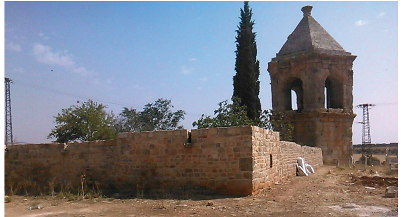
« Beşek ji kela Horî-Efrîn »

Lê tevî vê jî her miletekî tevdîr û huner û awayên jiyânê û nasname û resenî û taybetî yên xwe he ne; evan hemî vêkra bi kelepûra miletan tene navandin, û