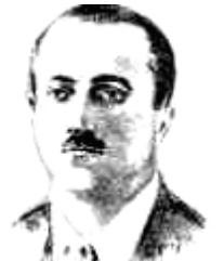
Osman Sebrî 1905 - 1993