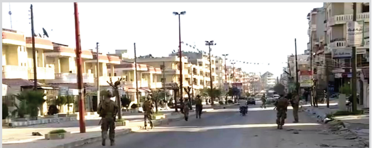
« Artêşa Tirkîyê di kolanên Efrînê de »

Di armancên kempeynê de boykotkirina kesên ku Tirkîyê û komên tundurê li