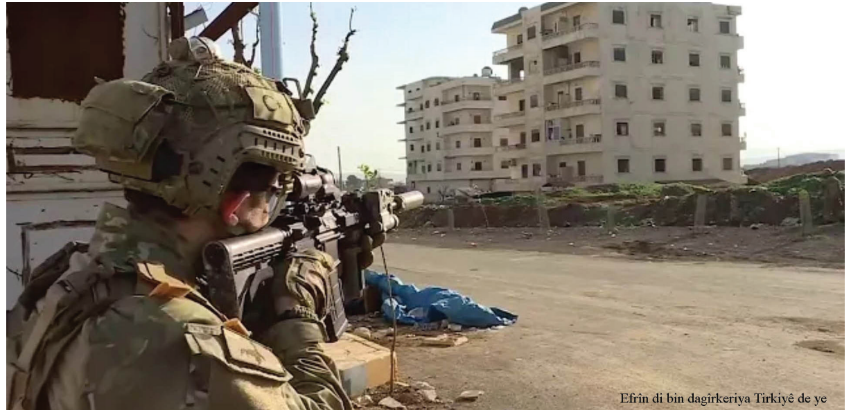
Efrîn di bin dagîrkeriya Tirkîyê de ye

Îro li rojavayê Kurdistanê, milletê kurd û xaka wî di bin gef û metirsiyê de ne, nemaze piştî dagîrkirina xaka bajarê