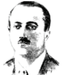
Osman Sebrî 1905 - 1993