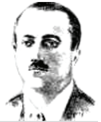
Osman Sebrî 1905 - 1993