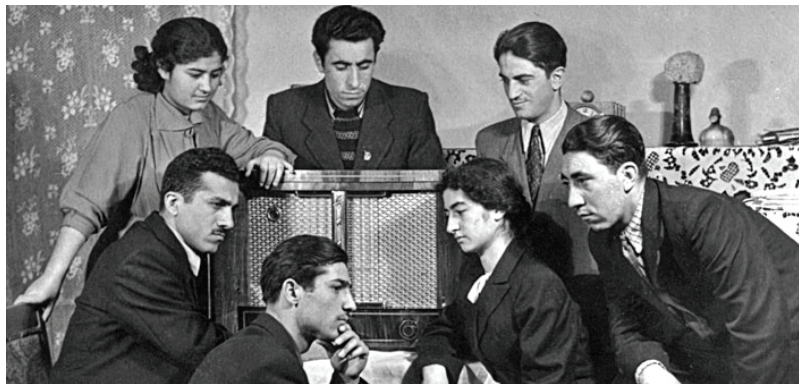
«Xwendekarên Kurd guhdarî radyoya Êrîvanê dikan»