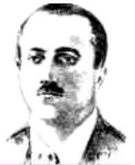
Osman Sebrî 1905 - 1993