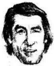
Dr. Nûredîn Zaza 1919 - 1988