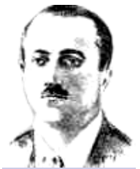
Osman Sebrî 1905 - 1993