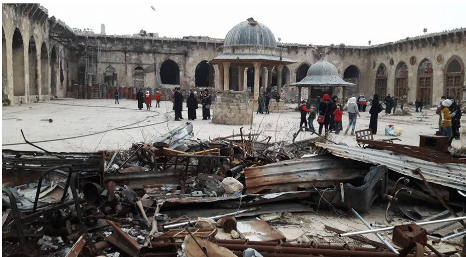
“ Ziyana tund û tûjiyê li Helebê “

Wê hîngê tevgera kurdî ser û ber metisiyên xwe ji encamdanên kirêt û bi tirs ji wê rêderxistinê da diyarkirin. Û bi yek dengî got: Em bi şoreşa azadî û rûmetê ya aştiyane re hevkar in, lê tu carî jî nabin hevalê çekaranînê. Çimkî ziyana bikaranîna çekdarkirinê li ser giyanwer û negiyanwer, serzemîn û binzemîna welêt gelekî pir e. Her weha heyam, sîstem û zagonên ceng û şer ji yê şoreşeke aştiyane başqetir, taybetir û çetintir in. Di heyama şer û dogişan de, aramî namîne, guftûgo lawaz dibe, û dem dibe dema çek û çekdaran û rola siyasetmedar, rewşenbîr û hişmendana pir lawaz dibe, û berjewandiyên navdewletî jî li ser wan ferz dîke ku ji bo çî çareseriyê be, berê xwe bidin aliyên çekdar û xwedî hêz, û