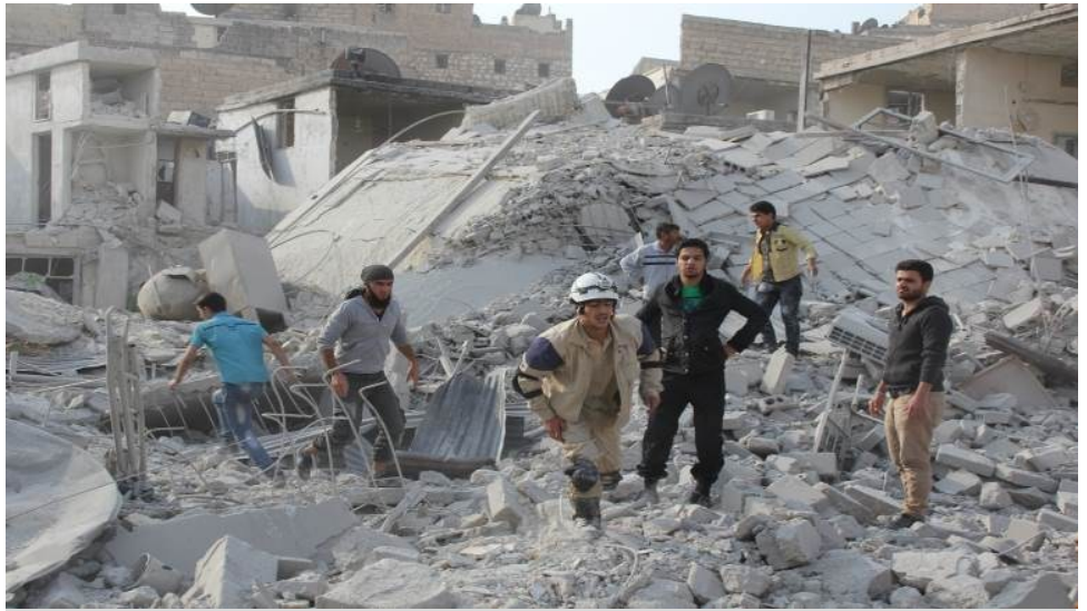
“ Hilweşandina bajarê Heleb ”

Vêca vê tevlîhevîna berjewendiyên ne wek hev, hîşt ku