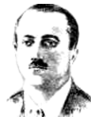
Osman Sebrî 1905 - 1993