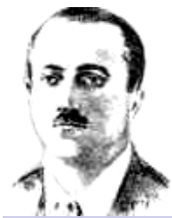
Osman Sebrî 1905 - 1993