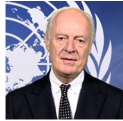
" Dê Mîstora "

Partiya Yekîtiya Demokrat a Kurd li Sûryê.