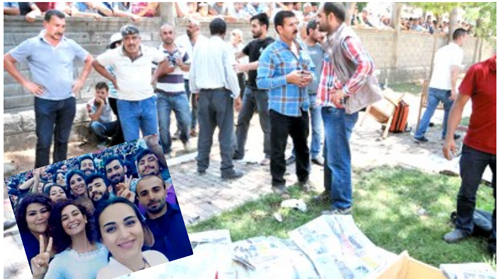
"Xelik li şûna Komkujiya Pirsûsê matmayî mane"

Piştî ku Yekîneyên Parastina Gel, bi hevkarîya Pêşmergeyên Herêma Kurdistanê û Hevbendîya Navdewletî bi hêza xwe ya ezmanî bajarê Kobanê û gundewarên wê ji çeteyên Da'îş rizgar kirin, serê pir aliyên ku naxwezî gelê Kurd xwe û herêmên xwe ji teror û wêrankirinê biparêzin, bi rêbazên curbecur, bi dizî û eşkere nerazîbûna xwe nîşan dan, li ser serê wan jî dewleta Tirkîyê tê. Lê piştî ku Girê Sipî(Til Ebyed) jî hate rizgarkirin, asta wê nerazîbûn û çavrosiyê li ser ekranên TVyan bilind bû, ta komkujiya roja 25ê meha Pûşberê li bajarê Kobanê û gundên wê bi destên çeteyê Da'îş çêbû. Lê dîsa jî, çavrosiya wan xêrnexwez û destqulên bi Da'îş re ko ne bû, her ..... ②