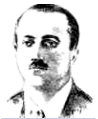
Osman Sebrî 1905 - 1993