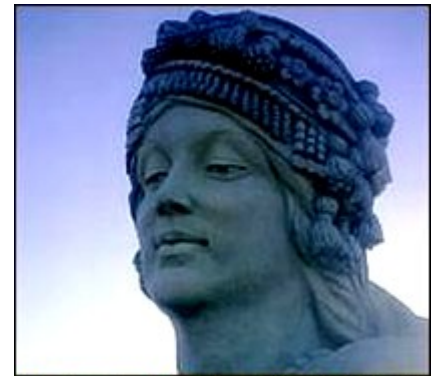
Peykerê Mestûre Kurdistanî

- 7 Lîza Xanim: Navê wê xatûnê wek cewhereke şevçirayê di wêjeya kurdî de dileyze. Lîza Xanim di sedsala pêncem koçî de jîya ye. Ew bi eslê xwe ji bajarê Şarezûrê ye, lê belê maweyeke dirêj li Loristanê jîyan domandîye. Ew di lédana tembûrê de jî sareza û hoste bû,