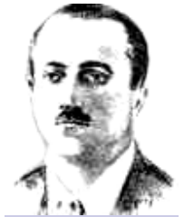
Osman Sebrî 1905 - 1993