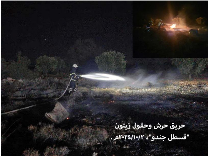
حريق حرش وحقول زيتون "قسطل جندو"، ٢٠٢٤/١٠/٢ م.