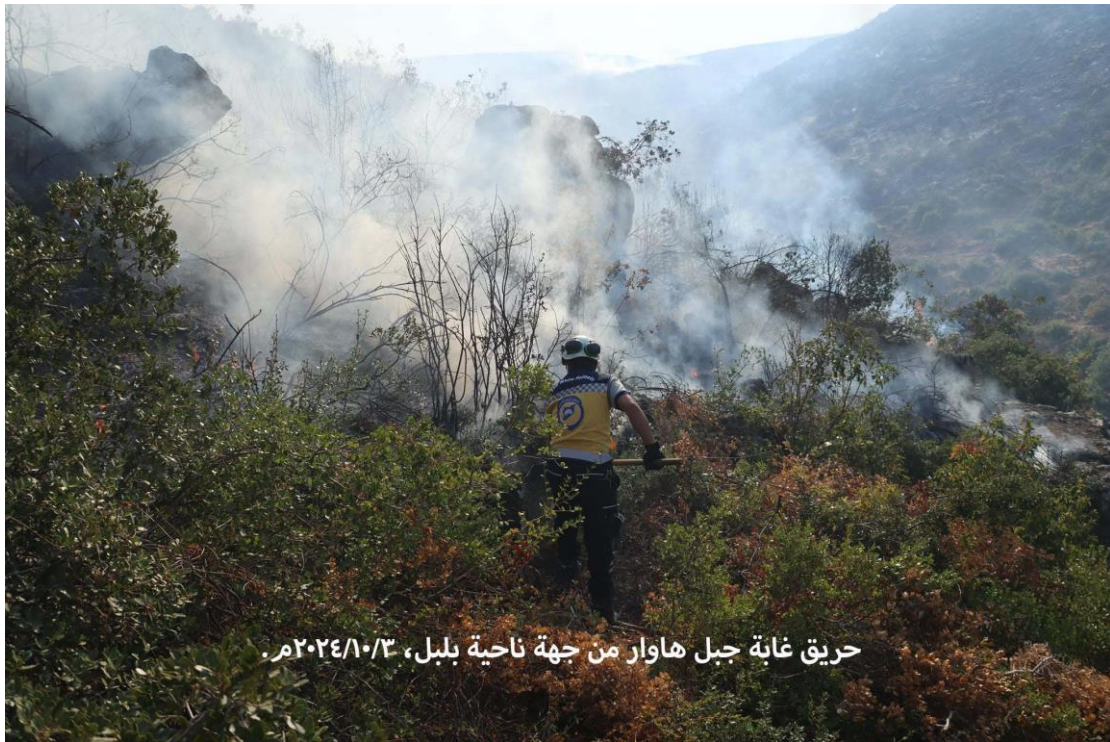
حريق غابة جبل هاوار من جهة ناحية بلبل، ٢٠٢٤/١٠/٣ م.

ذكرت وزارة الدفاع التركية عبر منصة "إكس" أنّ سلجوق بيرقدار أوغلو قائد القوات البرية في الجيش التركي، برفقة قادة عسكريين آخرين، في ٢٠٢٤/١٠/٢ م، قد زاروا "إحدى القواعد العسكرية في منطقة عمليات غصن الزيتون" (قاعدة كفرجنة/عفرين العسكرية التركية)، في تأكيد جديد لسيطرة تركيا العسكرية والحكومية الفعلية على منطقة عفرين كقوة احتلال، ناهيك عن الزيارات الكثيرة لمسؤولي مختلف المؤسسات التركية إلى المنطقة، دون المناطق المحتلة الأخرى (أعزاز، الباب، جرابلس) بريف حلب الشمالي، بالإضافة إلى الوجود الدائم لمئات الموظفين الأتراك، عدا عن وحدات الجيش والاستخبارات التركية!