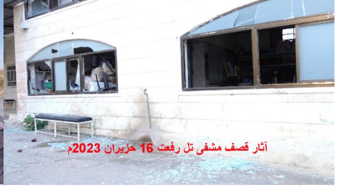
آثار قصف مشفى تل رفعت 16 حزيران 2023م