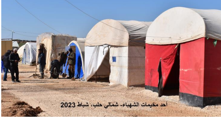
أحد مخيمات الشهباء- شمالي حلب، شباط 2023